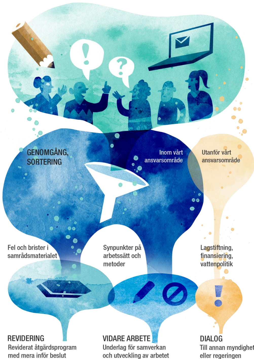
Figur 1. Övergripande process för hur vattenmyndigheterna tar hand om samrådssynpunkter. Vi går igenom och sorterar alla synpunkter. Vissa leder till att samrådsmaterialet revideras inför beslut. Illustration Rebecca Elfast.

Synpunkter från kommuner, myndigheter, bransch- och intresseorganisationer, vattenråd med flera