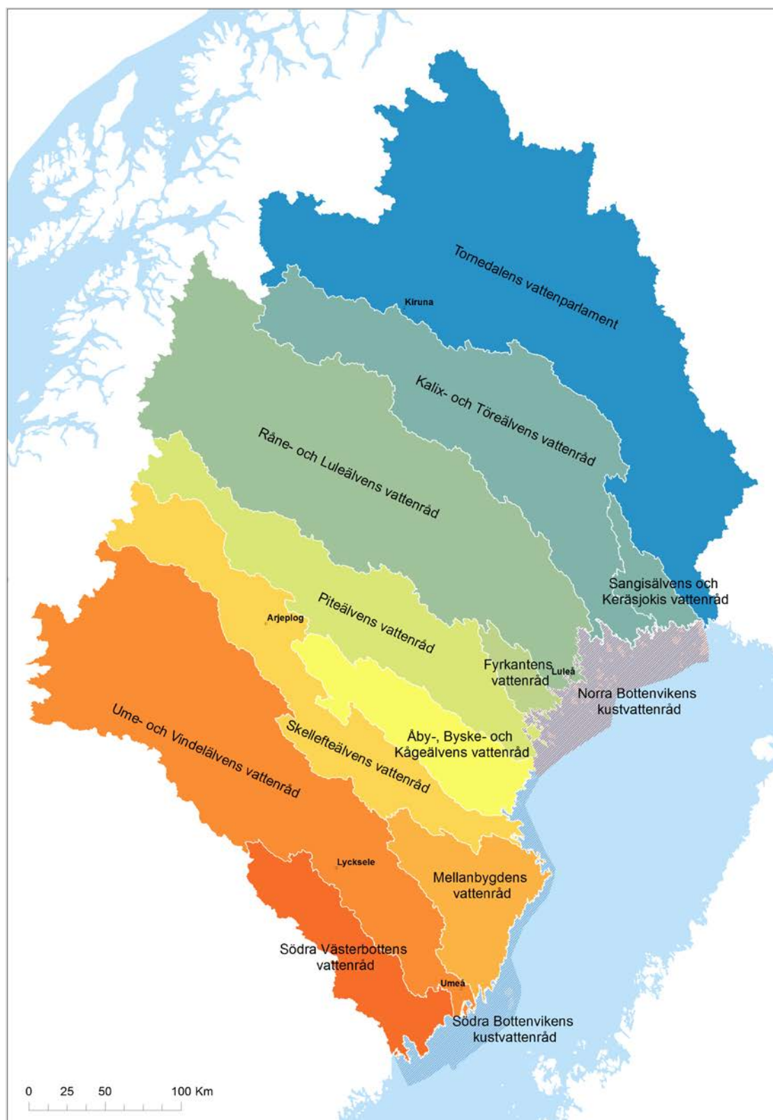
Figur 2. Bottenvikens vattendistrikts vattenrådsområden.