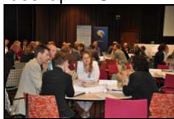
Diskussioner i smågrupper under mötet.

Om fem år ska alla EU-länder ha rent vatten – hur ska det målet nås? Kan EU:s medborgare involveras i arbetet för bättre vatten? Hur påverkar ett förändrat klimat tillgången till rent vatten i Europa? Det var några av de frågor som diskuterades när Europas vattenmyndigheter träffades i Stockholm den 19-21 augusti, ett av många möten under Sveriges ordförandeskap i EU.