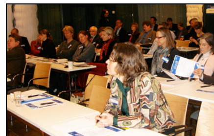
Nationellt Vattenforum 2009.

Den 5 februari gick Nationellt Vattenforum av stapeln i Stockholm. Konferensen samlade ett sextiotal deltagare från en mängd olika statliga verk och myndigheter, kommuner, branschorganisationer, konsulter och media. Det gavs mycket tid till diskussioner och frågor. Program och presentationer hittas på webbplatsen .